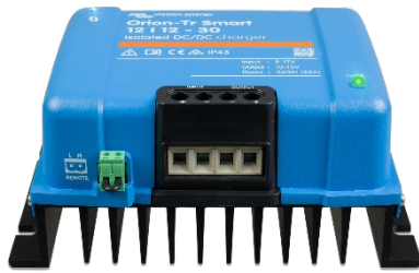
Orion-Tr Smart 12/12-30