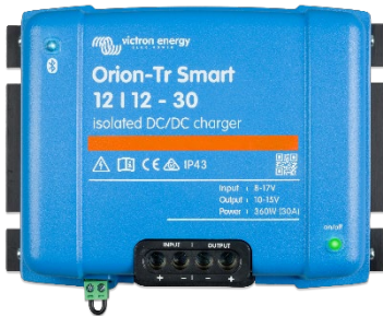
Orion-Tr Smart 12/12-30